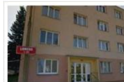
Pohled na byt

Datum prodeje: 01.02.2013 Doba prodeje: neví Kupní cena: 990.000 Kč